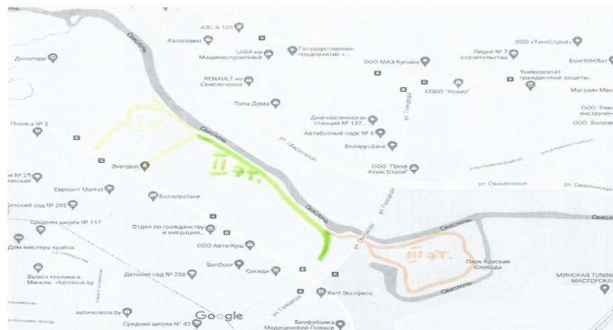
The layout of the stage III